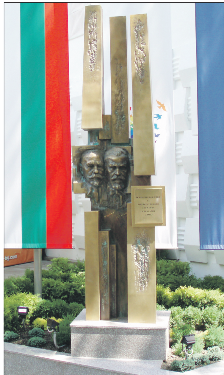
Барелефът на основоположниците на кооперативното движение в България, Тодор Йончев и Тодор Влайков пред сградата на Централния кооперативен съюз. Той бе изработен по решение на Управителния съвет на ЦКС и тържествено открит от президента на Република България - Георги Първанов през 2006 г.

Използвани са материали от книгата „Тодор Йончев - Олимпиаца“ на Зоя Апостолова и статията на доц. Лозан Митев – „Национална спортна академия „Васил Левски“ - „Примерът на Съюза на българските гимнастически дружества „Юнак“ за възпитанието и опазването на българската младеж 1895-1946 г.“